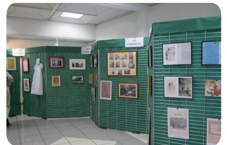
Une partie de l'exposition consacrée à sa vie