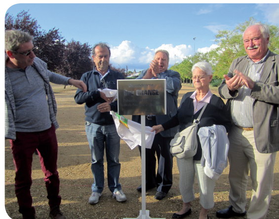
la plaque est dévoilée par Mme Grange et son fils.