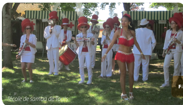
l'école de samba de Tours