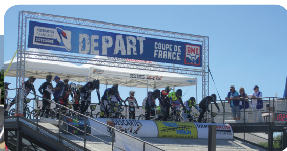
Pilotes au départ et sur la piste