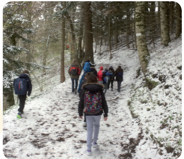
les élèves de Balesmes en randonnée

Séjour en Auvergne : Grâce au financement de la municipalité, de l'APE et de la coopérative scolaire, les élèves de CE2/CE1 et CM2 ont participé à une classe transplantée à La Bourboule. Lié à un projet d'apprentissage sur le volcanisme, le séjour a permis aux élèves de réinvestir leurs compétences, visiter Vulcania, randonner dans un cratère. Un séjour riche en apprentissages et en émotions.