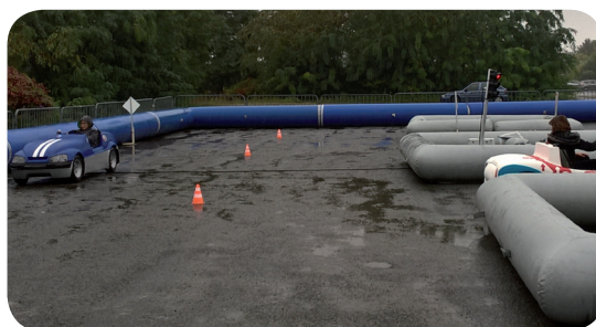
l'épreuve de conduite sous la pluie

Les élèves passaient successivement par trois ateliers : une initiation aux panneaux routiers sous une tente, un test de conduite par groupe de quatre dans des petites voitures électriques sur une piste avec des rues délimitées par des structures gonflables, des panneaux routiers et des feux de signalisation, et une épreuve récapitulative des panneaux routiers dans le grand camion de l'Automobile Club de l'Ouest. Des notes étaient attribuées à chaque enfant, qui ont reçu ensuite des diplômes et des médailles. Et celui qui a obtenu les meilleures notes participera à une finale nationale au Mans, lors des 24 Heures !