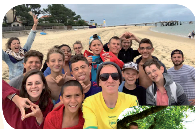
Les Ados à Mios