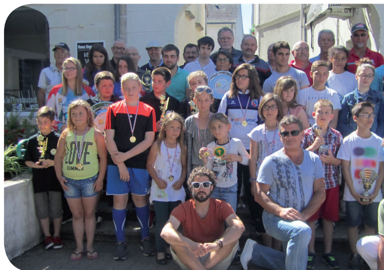
les champions récompensés et les élus