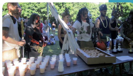
L'équipe des As'Soiffés, gagnante du Prix du meilleur déguisement

* Les Classements : - 1 er l'équipe du GIPE (parents d'élèves du collège) - 2 ème Les As'Soiffés - 3 ème Les Clickers - Meilleurs déguisements : 1 er l'équipe des As'Soiffés - 2 ème Le club de Ju-Jitsu - 3 ème Les Sans prise de Tête