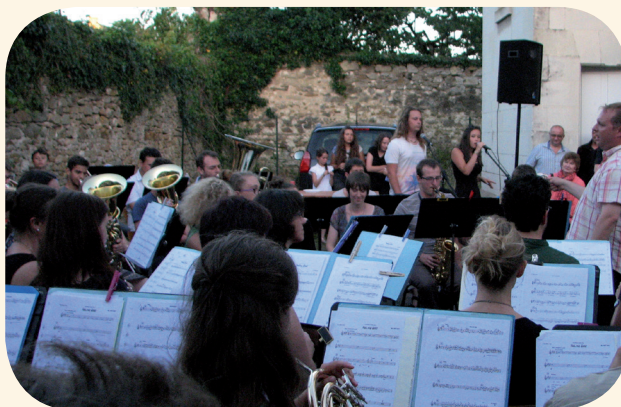
L'orchestre dans la cour de l'école