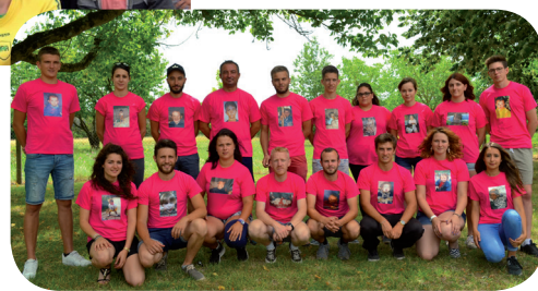
Le groupe des animateurs