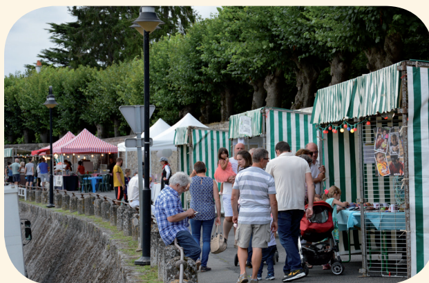
Marché nocturne quai Couratin