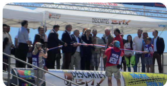
inauguration de la piste