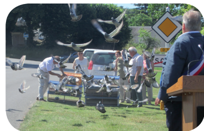
Envol des pigeons